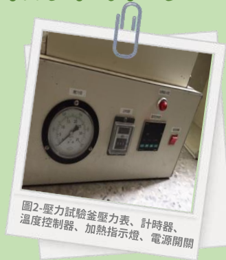
圖2-壓力試驗釜壓力表、計時器、溫度控制器、加熱指示燈、電源開關