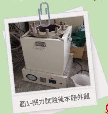
圖1-壓力試驗釜本體外觀